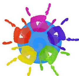
ATENCIÓ A LA DIVERSITAT